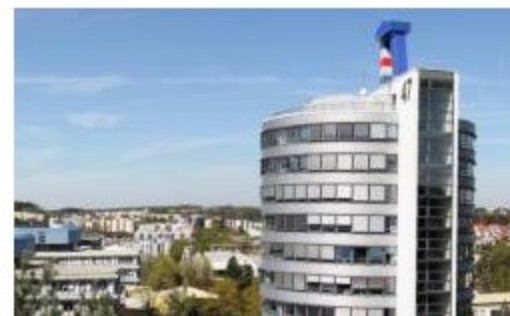
Der Campus der TU Kaiserslautern (Abb. © TU Kaiserslautern)

Die Technische Universität Kaiserslautern setzt auf eine neue Leittechnik und ein offenes Gebäudeautomationssystem.